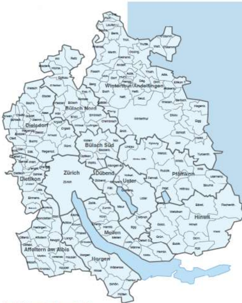
Die KESB-Kreise im Kanton Zürich