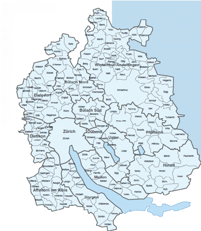
Die KESB-Kreise im Kanton Zürich